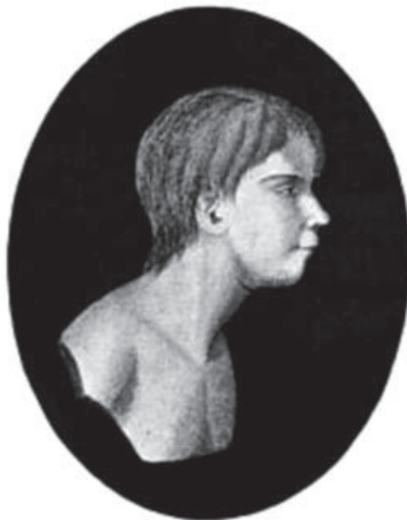
Der Wölfe von Aveyron.

Itard lo describe cómo “Un niño desagradablemente sucio, afectado por movimientos espasmódicos e incluso convulsiones; que se balanceaba incesantemente como los animales del zoo; que mordía y arañaba a quienes se le acercaban; que no mostraba ningún afecto a quienes le cuidaban y que, en suma, se mostraba indiferente a todo y no prestaba atención a nada.” “Aparentaba unos 11 o 12 años. Era delgado y más bien bajo (1,35cm) para su supuesta edad. Su rostro, redondeado e infantiloides, presentaba marcas de haber sufrido la viruela y lo surcaban veintitrés cicatrices. Su nariz era larga y puntiaguda y su mentón hundido. Tenía un cuello largo y esbelto, pero otra gran cicatriz le atravesaba la garganta.” Supuso que llevaría perdido como máximo desde los 4 años, pues era improbable que hubiera sobrevivido siendo menor y dado que había sido avistado dos o tres años antes por la zona, supusieron que estuvo salvaje aproximadamente 7 años, aunque era difícil de determinar.