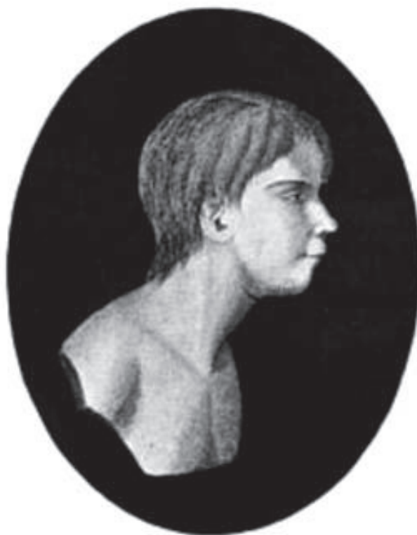
Der Wilde von Aveyron.

Itard descríbeo como “un neno desagradablemente sucio, afectado por movimientos espasmódicos e mesmo convulsións; que se balanceaba incesantemente como os animais do zoo; que mordía e rabuñaba aos que se lle achegaban; que non mostraba ningún afecto aos que o coidaban e que, en suma, se mostraba indiferente a todo e non poñía atención en nada... Aparentaba uns 11 ou 12 anos. Era delgado e máis ben baixo (1,35 cm) para a súa suposta idade. O seu rostro, redondeado e infantil, presentaba marcas de sufrir a varíola e sucábano vinte e tres cicatrices. O seu nariz era longo e puntiagudo e o seu queixo afundido. Tiña un colo longo e esvelto, pero outra gran cicatriz atravesáballe a garganta“ . Supuxo que levaría perdido como máximo dende os 4 anos, pois era improbable que sobrevivise sendo menor e dado que fora avistado dous ou tres anos antes pola zona, supuxeron que estivo salvaxe aproximadamente 7 anos, aínda que era difícil de determinar.